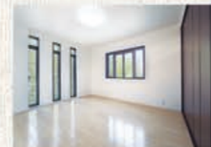
採光部を多くとり、明るい居室。