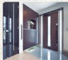
十分な収納力を誇る玄関ホール。上品な輝きを放つ床材や建具の色合いはいつも美しく、家族やゲストの目を惹きつけます。