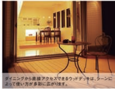
ダイニングから直接アクセスできるウッドデッキは、シーンによって使い方が多彩に広がります。