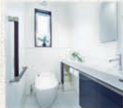
「アラウーノ」を採用し、カウンターと手洗いを設けた、まるでホテルのトイレのようなワンランク上の空間。収納スペースも十分にご用意しました。