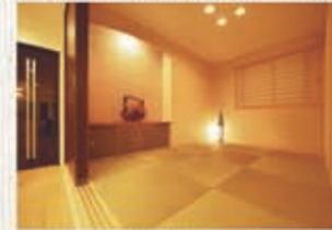
リビングから一段あがった和室は、心落ち着く上質の空間。花やインテリアがよく映える棚もあり、機能性が満たしています。