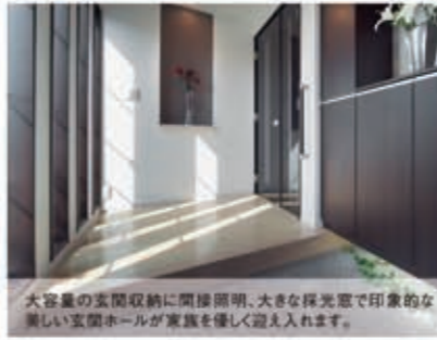
大容量の玄関収納に間接照明、大きな採光窓で印象的な美しい玄関ホールが家族を優しく迎え入れます。