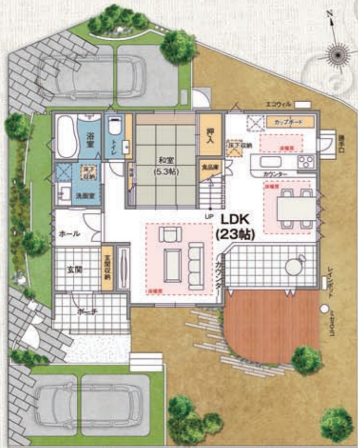
※外構園は実際とは多少異なります。