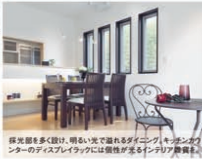
採光部を多く設け、明るい光で溢れるダイニング、キッチンカウンターのディスプレイラックには個性が光るインテリア飾物を。