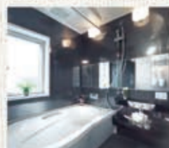
1616サイズのゆったりとした浴室は、浴室暖房乾燥機や保温浴槽などの嬉しい仕様で、一日の疲れを取り明日への美肌を養う癒しの空間です。