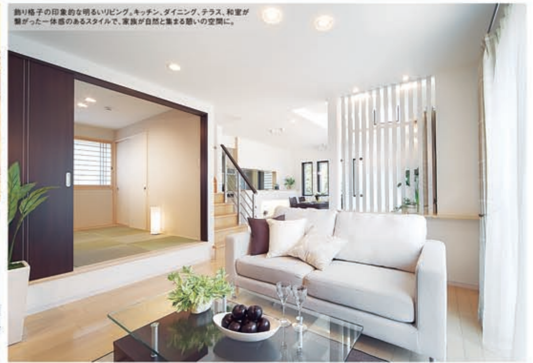
飾り格子の印象的な明るいリビング。キッチン、ダイニング、テラス、和室が繋がった一体感のあるスタイルで、家族が自然と集まる憩いの空間に。